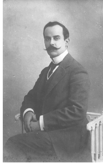
Hüseyin Cahit Yalçın

Hüseyin Cahit Yalçın, 1875-1957 yılları arasında yaşamış gazeteci, yazar, düşünce insanı ve eleştirmen olarak Tanzimat, Servet-i Fünun, Meşrutiyet ve Cumhuriyet dönemlerine tanıklık yapmış ve bu süreçte yaşanan siyasi gelişmelere ilişkin görüşlerini gerek kendi çıkarıldığı dergi ve gazetelerde gerekse farklı süreli yayınlarda dile getirmiş önemli bir şahsiyettir. Henüz Mekteb-i Mülkiye'de öğrenciyken çeşitli gazete ve dergilerde hikâye, çeviri, fıkra, eleştiri türünde yazılar kaleme alan Yalçın, II. Meşrutiyet'e gelindiğinde başyazar sıfatıyla kendisini gösterir. "Dünyanın en fazla yazan gazetecisi", "Büyük mücahit" 1 gibi sıfatlarla da anılan isim, uzun yıllar sahipliğini ve başyazarlığını yaptığı Tanin 'le özdeşleşmiş ve kendi ifadesiyle "başına ne geldi ise Tanin yüzünden gelmiştir." 2