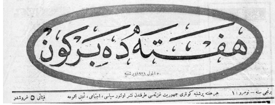
Haftada Bir Gün mecmuasının ilk sayısının klišesi

İlan edildiği tarihte yeni devletin yönetim şeklini ortaya koyan Cumhuriyet; siyasi, sosyal ve kültürel hayatımızda bir milat niteliği taşımaktadır. 4 Kasım 1923 tarihli Resmî Gazete’de yayımlanan Teşkilat-ı Esasiye