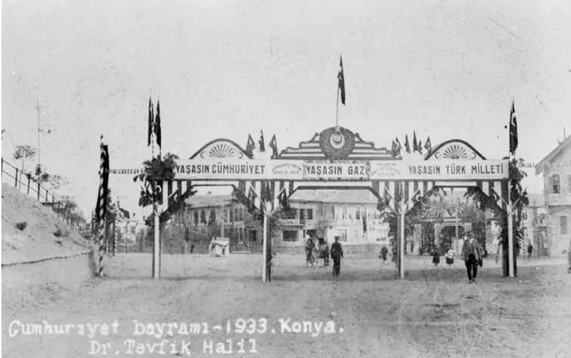
1933 yılında Konya'da düzenlenen Cumhuriyet kutlamalarından bir görüntü.

Cumhuriyet yönetim biçimi Eski Yunan ve Roma dönemlerine dayandırılmakta, Orta Çağ'da İtalya'da kurulan Venedik, Cenova ve Floransa devletleri bu yönetim biçiminin ilk örnekleri sayılmaktadır. Fakat bunların, bugün anladığımız anlamda cumhuriyet olmadıkları bilinmelidir. Halk egemenliğine dayanan özgürlükçü, eşitlikçi cumhuriyetler esas itibariyle 1776'da Amerika'da ve ardından 1789'da Fransa'da çetin mücadeleler sonucunda kurulmuştur. Günümüzde yurttaşların hak ve özgürlüklerinin simgesi sayılan Batı demokrasisi, en gelişmiş devlet yönetimi olarak kabul edilmektedir ve bu yönetimde en üst düzeyde halk katılımı sağlanmaya çalışılmaktadır.