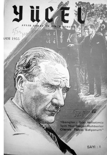
Yücel mecmuasının kapak fotoğraflarından biri.

Bugün ilk sayısını sunduğumuz 'Yücel' gençlik, kültür ve bilgi cöngüdür. Amacı, gençlik için çalışmak