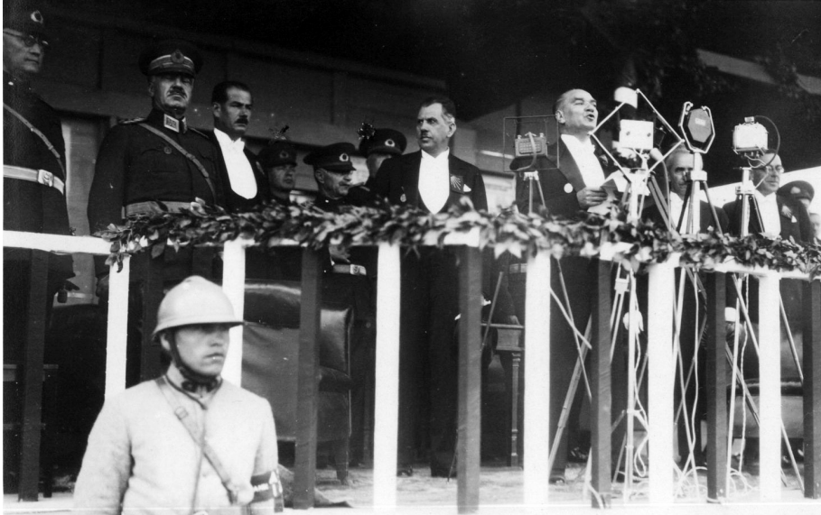
Atatürk Nutuk 'unu okurken. (Atatürk Kitaplığı Arşivi).

Tarih bilinci; geçmişi eksiksiz bilmek, doğru anlayabilmek, farklı yönleriyle içselleştirebilmek, dünü bugünle kıyaslayarak geçmişten ders çıkarabilmekle oluşur; bu bilincinin inşasında ve millî benlik duygusunun gelişiminde tarihi bilmek kadar tarihî şahsiyetleri de yakından tanımak gereklidir. Tarihî