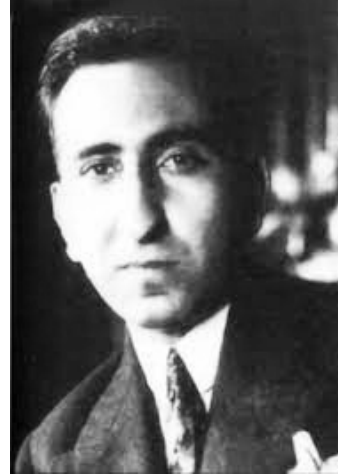
Etem İzzet Benice.

Yazarın asıl adı İbrahim Ethem'dir. Bununla birlikte yazar 1935'ten sonra isminin orijinalini değil de halk söyleyişine daha uygun gördüğü Ethem yerine Etem'i kullanmıştır. 1 1903 yılında İstanbul Kasımpaşa'da doğan Benice, eğitimine burada Cezayirli Gazi Hasan Paşa Mektebinde başlar. Bu okulu tamamladığı yıl Birinci Dünya Savaşı'nın başlamasına bağlı olarak babası Kemahlı Mehmet İzzet Bey tarafından Çorum İskilip'te bulunan dayısı Doktor Lûtfi'nin yanına götürülür. Ethem İzzet, eğitimine buradaki rüştiyede devam eder. Bu okulu bitirdikten sonra da ailesini bırakıp İstanbul'a döner ve Galatasaray Sultanisine girer, ardından da Kabataş Sultanisinde eğitimini sürdürür. Onun yazıyla, edebiyatla ilişkisi burada ortaya çıkar. Kabataş'ta Mefkûre adlı bir gazete çıkarıp gazeteciliğe ilk adımını atar. Daha sonra da Tarik gazetesinde çalışmaya başlar ve ilk hikâyelerini bu gazetede yayımlar.