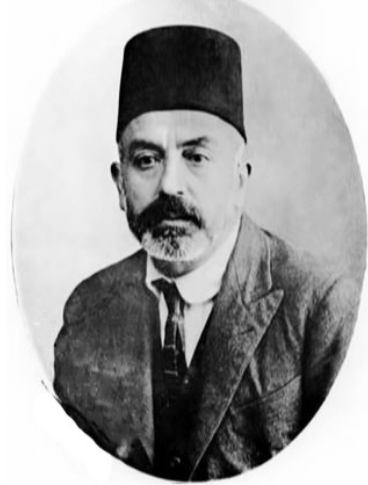
Mehmet Âkif Ersoy.

İşte o tebliğde, bu uzun tarihi kendi içinde daha anlaşılır kılmak için, belli başlı nirengilerin varlığına dikkati çekmişim: İstiklal Marşı'nın yazıldığı dönem ve marşın kabulü (12 Mart 1921), aradan henüz dört yıl bile geçmemişken, sonuç veremeyecek yeni bir İstiklal Marşı yarışmasının daha açılması (13 Kasım 1925). Bir süre sonra da dönem iktidarı adına farklı bir yol