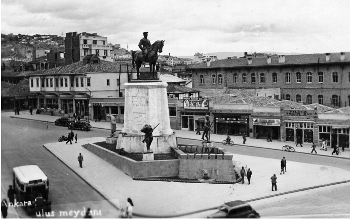
Ankara, Ulus Meydanı.

İnsanların kaderleri olduğu gibi şehirlerin de kaderleri vardır. 1920 yılı, Ankara'nın kaderinde bir dönüm noktasıdır. Bu tarihe kadar Ankara; keçisi, kedisi ve armuduyla tanınan tozlu ve sıtmal bir Anadolu kasabası görünümünde iken İstanbul, yüzyıllardır Türklere başkentlik yapmış bir şehir olarak karşımıza çıkar. Payitahtın işgali padişahın özgür iradesini kısıtlar. 16 Mart 1920'de Meclis-i Mebusan baskına uğrar, üyeleri sürgüne gönderilir. Bu baskından kaçmayı başaran devlet adamları, mebuslar, sanatçılar ve askerler akınlar hâlinde Anadolu'ya geçer. Mustafa Kemal, yaklaşık bir yıl önce Anadolu'ya gelmiş ve karargâh merkezi olarak Ankara'yı seçmiştir.