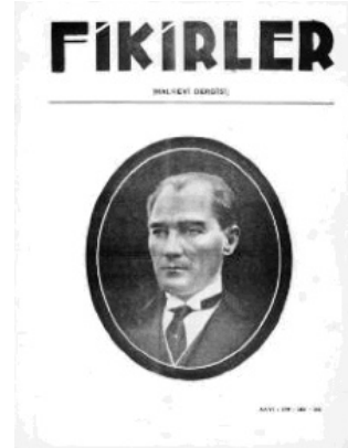
İzmir Halkevi dergisi Fikirler ’in kapak fotoğrafı.

Halkevlerinde yapılan en kalıcı ve etkili faaliyetlerinden birisi dergi yayıncılığıdır. Halkevleri bünyesinde yayımlanan Ülkü (Ankara Halkevi) başta olmak üzere, Halk Bilgisi Haberleri (Eminönü Halkevi), Fikirler (İzmir Halkevi), İnanç (Denizli Halkevi), Gediz (Manisa Halkevi), Kaynak (Balıkesir Halkevi), Görüşler (Adana Halkevi), Ün (Isparta Halkevi) gibi yayın organları, yaklaşık yirmi yıl yayın hayatını sürdürmeyi başarmış dergilerdir. Bunların yanında irili ufaklı değişik adlar altında pek çok halkevinin dergi yayımlandığı bilinmektedir. Söz konusu dergilerde başta şiir olmak üzere, hikâye, tiyatro, roman vb. edebî türlerde sayısız eser neşredilmiştir. Bu eserlerden bazıları, yeni yetme yazar ve şairlerin basit yazı ve şiirlerinden oluşmaktadır. Buna karşılık Ülkü ve Fikirler başta olmak üzere, bazı halkevi dergileri,