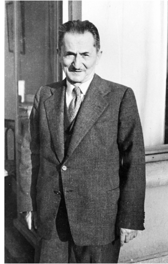
Reşat Nuri Güntekin.

Yazın hayatına Cumhuriyet dönemi öncesinde başlamakla beraber Cumhuriyet'in öncü yazarlarından kabul edilen Reşat Nuri Güntekin, eserlerini realist-romantik bir üslupla kaleme alır. Özellikle Batı edebiyatındaki realist yazarları ve Türk edebiyatında ise Halid Ziya Uşaklıgil'i takip eden Güntekin, hem bireysel konuları hem de toplumsal konuları ele alarak roman, hikâye, tiyatro, eleştiri, gezi yazısı gibi türlerde birçok eser ortaya koyar. Osmanlının son dönemi, II. Meşrutiyet'i, Birinci Dünya Savaşı ve Kurtuluş Savaşı yıllarını ve nihayet Türkiye