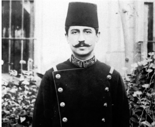
Cenap Şahabettin, gençlik yıllarında.

Fransa'da öğrenci olarak geçirdiği yıllar onu demokrasi ve sosyal ilişkiler üzerinde sadece kitaplardan edinilmiş bilgilerle değil, yaşantılarıyla da eğitmiştir. Onun toplum hayatı ve siyasetle ilgili pek çok yazısı vardır. Bunlarda savunduğu görüşlerin çoğu, üzerinde tartışılmayı abes saydıracak kadar açık gerçeklerdir. Ancak kuramlardaki görüşler, Cenap'ın yazılarında farklar gösterebilir. Cenap özellikle kişilerle ilgili görüşlerini çok kolay değiştirebilir ve önceki yorumlarındaki yanlışlarından hiç söz etmeden, övgüden lanete geçebilir. Eğitimi dolayısıyla mantıklı, düzgün bir düşünce yapısına sahip olan Cenap'tan okuyucu yanıldığı noktaları da itiraf etmesini ve bu değişimleri açıklamasını bekler. Yazılarının