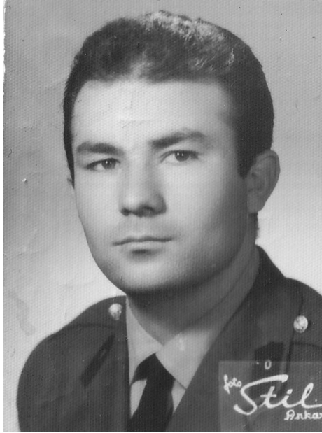
Ankara Polatlı Yedek Subay Okulu 1964.