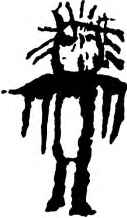
Resim 3. Merkezi Altay'da M.Ö. 2. bin yılına ait kadın şaman petrog-lifi, V. Kubarev'in makalesinden elib.gasu.ru/da/archive/2001/N6/09.html

nın kesintisiz rolü akademik çalışmalarda da kaydedilmiştir. Sibirya'da M.Ö. 1700-1300 yıllarının mezar kazıları da kadınların şaman aksesuarlarıyla gömüldüğünü gösterir. Bugün kadın şamanlığın Türk ve Moğol halklarında mevcut oluşu, Eskimo ve Kamçatka, Kore ve Japonlarda ise dominant olması bu kurumun ilkliği meselesiyle bağlantılıdır. Her ne kadar şamanlığın, en eski geleneksel tıbbın köklerinin kadınlara bağlandığı gösterilse de, bunun aksini söyleyenler de vardır. Bu bir gerçektir ki, şamanlık insanlık tarihinin tek tedavi edici ve ruh bilimci tecrübe-