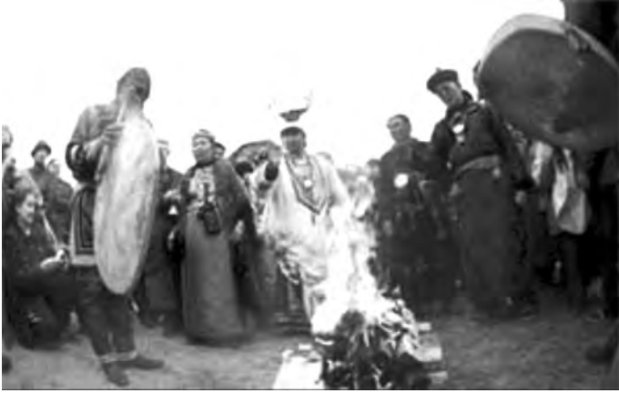
Resim 1: Kadın ve erkek şamanların bir arada yaptıkları en eski ritüel

kurumunun kadın eksenli bir yapılanma süreci geçirdiği tezi, bu tarihî ve sözlü verilere dayanır. Bazı Sibiryâ kadın şamanlarının özel giysi, davul ve benzeri çalgı aleti kullanmadan kamlık yaptıklarını göz önünde tutan Avrupalı araştırmacılar da, kadın şamanların yetenek ve güçlerinden övgüyle bahsetmişlerdir. Uzak Sibiryâ, özellikle de Kamçatka halklarının, Koryakların, Yukagirlerin şamanları olmadıkları bir dönemde kadınların özel kıyafet giymeksizin, davula sahip olmaksızın büyü yaptıklarını, kehanette bulduklarını, kamlık yaptıklarını hem gezginler hem de araştırmacılar bildirirler. 2