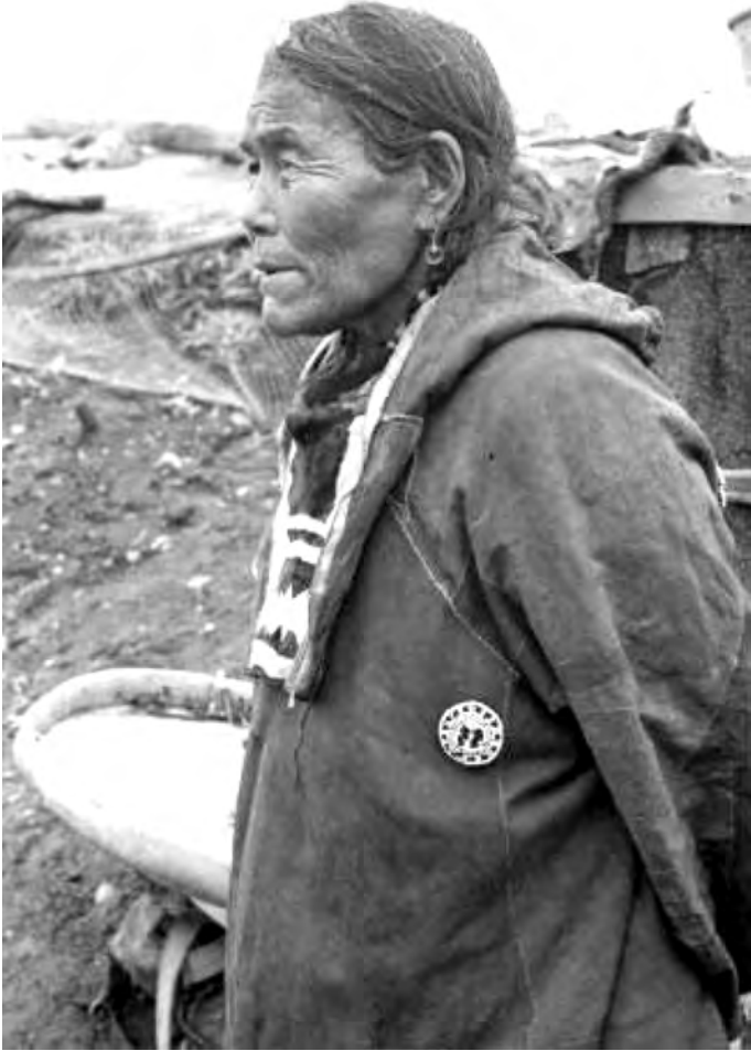
Resim 2. Koreli kadın şaman