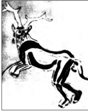
Resim 5. Fransa'nın Trois Frère mağarasında bulunan ve M.Ö. 40-10 bin yıl öncesine tarihlenen en eski şaman tasviri

cesedi olarak kabul edilir. 10 Buradan kadın şamanlığın yerleşik düzende eski konumunu koruyamadığı gerçeği ortaya çıkmış olur. Ancak eski Türk toplumunda, kadın şamanların avcılık döneminden itibaren konumlarını erkeklerle paylaştığı da bir gerçektir.