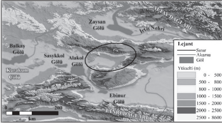
Harita: Ç'u-mu-kun: (Çomul veya Çomal) Boyunun Yurdu

738'de Türgiş Devleti'nde iç savaş çıkması ve dış tehditten dolayı can güvenliğinin yok olması üzerine Tch'ou-mou-koen (ok. Ç'u-mu-koen) boyunun geride kalanları Çin'e bağlanmak üzere dilekçe gönderdiler. 20