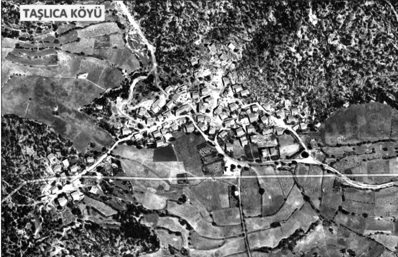
Uydudan Taşlıca köyü.