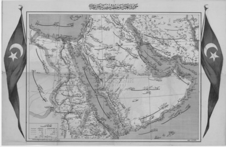
Harita-1: Ceziretü'l- Arab ve Hıttı-yı Mısriyye: Umum Arabistan, Suriye, Mısır, Habeşistan, Sudan, İnan, Afganistan vesaire.