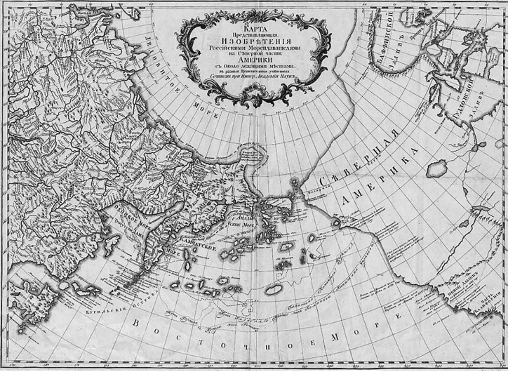
Rus Denizcilerinin, Farklı Seyahatlerinde Amerika'nın Kuzey Kısmı ve Çevresinde Yaptığı Keşifleri Gösteren Harita, Sankt-Petersburg Bilimler Akademisi, 1773