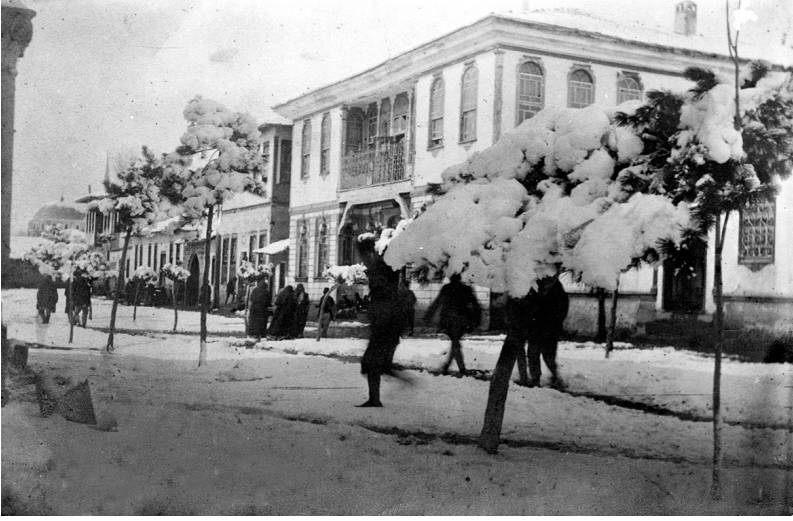
Yozgat. Hükümet Dairesi ve Caddesi. Sene 1340

Gösterilen kahramanlığın şahitlerinden Gâzî Osman Paşa, tabyalardan birinin adına Yozgat Tabyası adını vermiştir. Hatta Şıpka Muharebeleri'nde bozulmak üzere olan Kırşehir Taburu'nu yok olmaktan son anda Yozgatlılar kurtarmıştır!