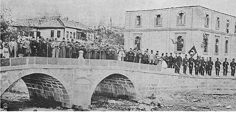
Nakıpzade Camii ve Batı Özü'ndeki Köprü

Bir hüziin kapladı şanlı Yozgad'ı Acı elemiini duyan kalmadı Bozuldu neş'esi arttı figanı Taşı taş üstüne koyan kalmadı