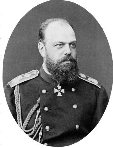
İmparator III. Aleksandr

Maliye Bakanı'nın hatıratı hariç tüm belgeler Çarlık yönetiminin emperyalist emellerini ve pazarlıklarını ifşa etmek amacıyla Bolşevik hükümetinin 1922-1941 yılları arasında çıkardığı ve çoğunlukla Dışişleri Bakanlığı'nın kapalı arşivlerindeki gizli belgelerle doldurduğu Krasny Arhiv dergisinden alınmıştır. “Hiçbir şey uzun bir süre gizli kalmaz” sloganıyla