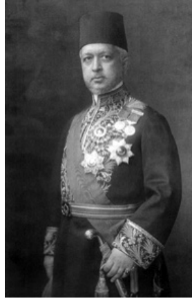
Said Halim Paşa