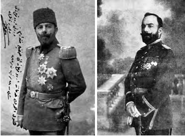
Cemal Paşa'ya dair iki fotoğraf