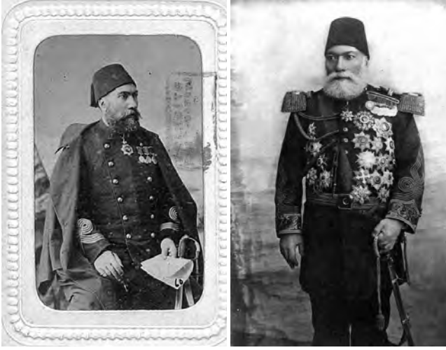
Gazi Osman Paşaya dair iki fotoğraf