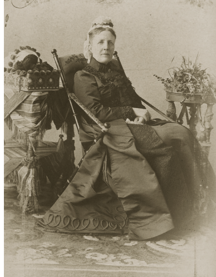
İsveç-Norveç Kraliçesi Sophia Wilhelmine Marianne Henriette