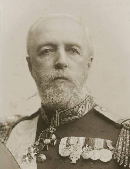
İsveç-Norveç Kralı II. Oscar Fredrik (National Portrait Gallery, London)

İsveç-Norveç Krallığı ve Osmanlı arasındaki yakın ilişkiler II. Abdülhamid'in saltanatı boyunca devam etmiştir. Bu ilişkideki en önemli olaylardan biri Birleşik İsveç-Norveç Kralı II. Oscar'ın 1885 yılında İstanbul'u gayriresmî olarak ziyaretidir. 2 Kral II. Oscar Fredrik'in (1829- 1907) İstanbul ziyaretinin diğer Avrupa hanedan üyelerinin ziyaretlerinden daha farklı ve özel bir nede-