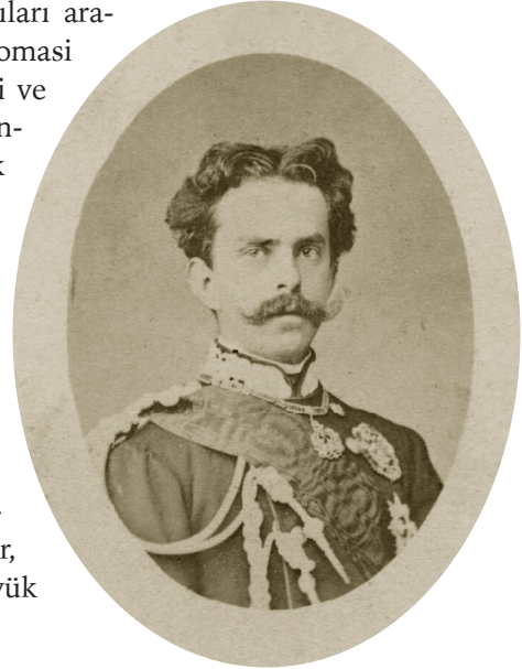
Savoya Dükü ve İtalya Kralı I. Umberto (National Portrait Gallery, London)

19. yüzyılda Osmanlı ile İtalya arasında hanedan üyelerinin İstanbul'a ziyaretleri sebebiyle yakın ilişkiler devam