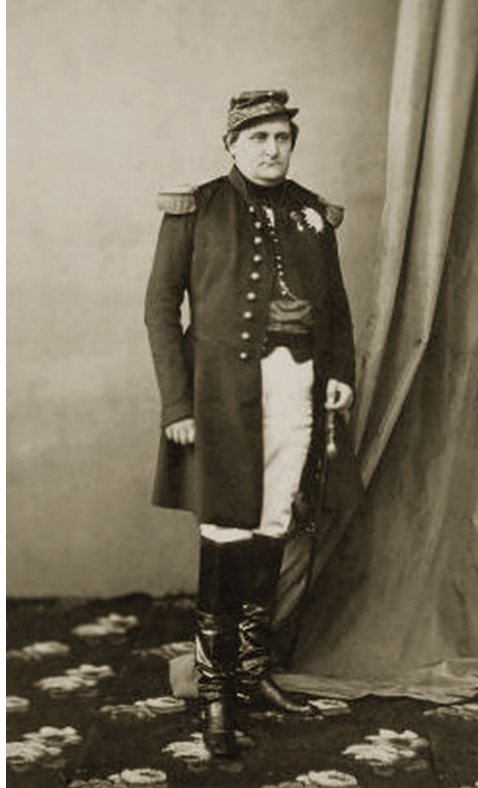
Prens Napolyon-Joseph-Charles-Paul Bonaparte

Prens Napolyon'un İstanbul'da ağırlanması tarihî değeri haiz bir olaydır. Çünkü bu ziyaret, kökleri oldukça eskiye giden Osmanlı-Fransız ilişkilerinin ortak geçmişinde, Fransız hanedan ailesinden bir prensin Osmanlı topraklarında ilk kez ağırlanması ba-