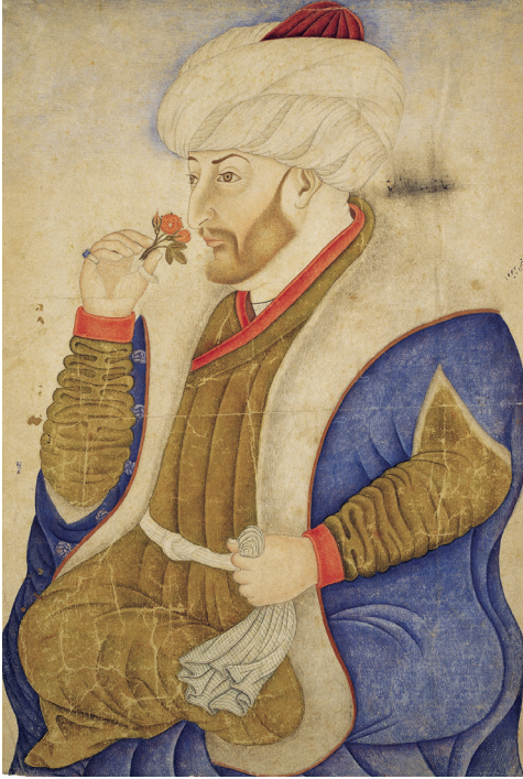
Fatih Sultan Mehmed portresi (TSMK, H. 2153, y. 10a)

Fatih Sultan Mehmed (1444-1446, 1451-1481) döneminde İstanbul'un fethiyle beraber Bizans sahneden çekilirken Osmanlı bölgede büyük bir güç hâline gelmiş, imparatorluğun devletler arası ilişkileri yönlendirme gücü de artmıştır. Konumu gereği siyasi, askerî ve ticari faaliyetlerin merkezi konumunda olan İstanbul, Osmanlı'da diplomasi'nin kalbi ve bir yönetim merkezi olarak şekillenmiştir. İstanbul bu ticari ve siyasi gücüyle dünya diplomasi-