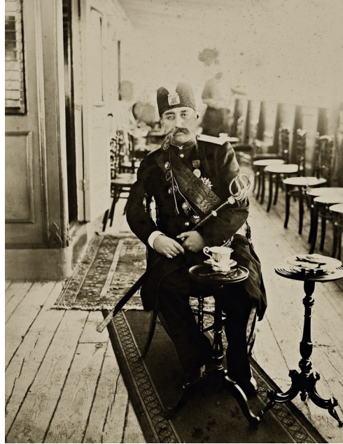
Kaçar Şahı Muzafferüddin

Muzafferüddin Şah Avrupa seyahati dönüşünde İstanbul'a hareket etmiş, Belgrad tren istasyonunda Sultan'ın görevlendirdiği bir Osmanlı heyeti tarafından