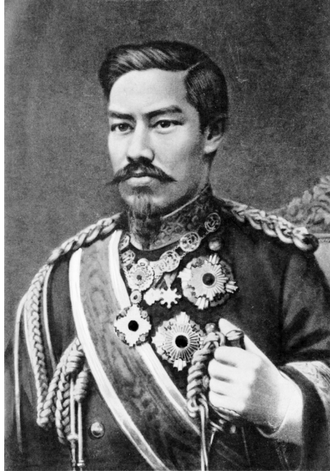
Japon İmparatoru Mutsuhito Mikado Meiji

Prens Komatsu Avrupa'da bulunduğu dönemde İstanbul'u ziyaret etme ve Padişah'ın huzuruna