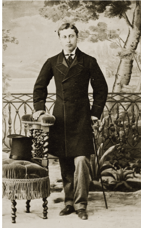
Prens Edward'ın Abdullah Biraderler tarafından çekilen fotoğrafı (Royal Collection Trust / © Her Majesty Queen Elizabeth II 2022)

İskelede Sultan Abdülaziz tarafından karşılanan Prens ve beraberindekiler doğrudan Dolmabahçe Sarayı Mâbeyn-i Hümayun'a geçmiş burada kabul töreni gerçekleştirile-