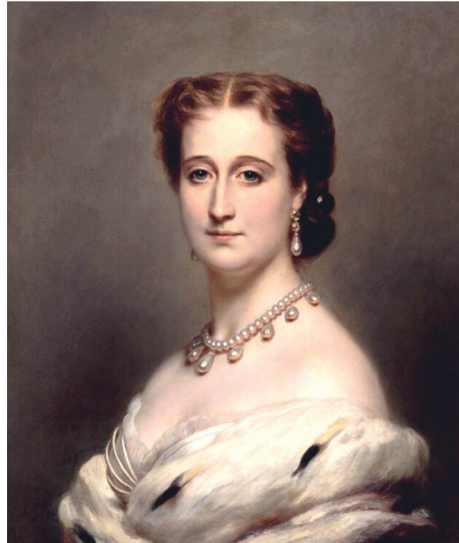
İmparatoriçe Eugénie de Montijo (Franz Xaver Winterhalter, 1864)