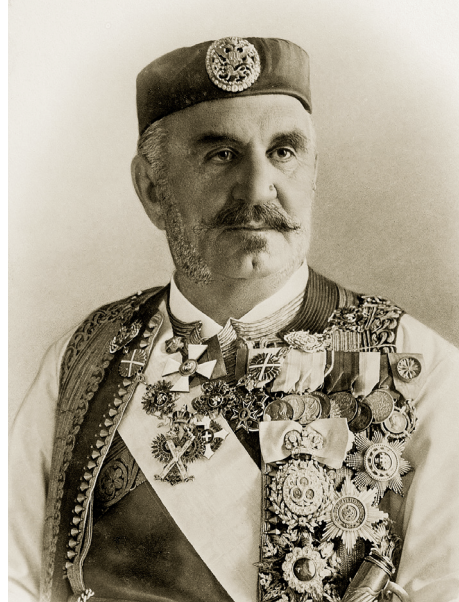
Karadağ Prensi Nikola I. Petroviç