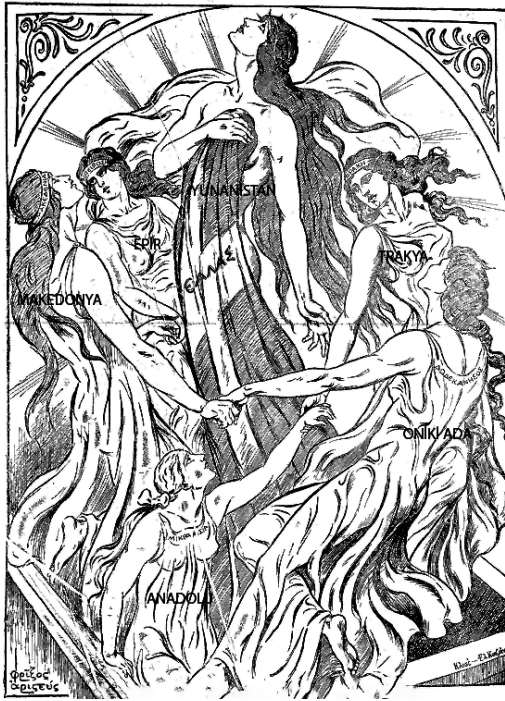
İllüstrasyon 1: Embros gazetesi 20 Nisan (7 Nisan 1919)

yapısının ürünüdürler. 30 Yunanistan'ın 15 Mayıs 1919'da İzmir'e çıkmasından kısa bir süre önce Embros gazetesinde anne olarak tasvir edilen Yunanistan'ın etrafında kızları olarak Makedonya, Epir, Trakya ve Onikiada ile birlikte elini uzatmış bir şekilde Anadolu resmedilmiştir ki, bu illüstrasyon da Zafiriyyu'nun sözleriyle aynı paraleldedir. Megali İdea Yunanistan'da halk yığınları arasında yankı bulmuş ve romantizmiyle halkı ulusal bir ortaklık etrafında birleştirmiş, siyasetçiler tarafından da kullanılmıştır. 31