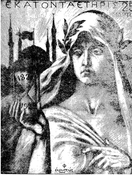
İllüstrasyon 3: Embros gazetesi 7 Nisan 1921 (25 Mart 1921)

Skrip gazetesinin Miladi takvimle 14 Ocak, ancak Yunanistan'ın o tarihte kullanmış olduğu Julius takvimine göre 1 Ocak 1921'de yayınlamış olduğu illüstrasyonda, Kral Konstantin Ayasofya önünde resmedilmiştir. Skrip 'te yayınlanan bir başka illüstrasyonda ise Kral Konstantin çift başlı kartal önünde görülmektedir. Bizans bayrağında da kullanılmış olan çift başlı kartalın sol pençesinde kılıç, sağ pençesinde ise haç dikkat çekmektedir. Kılıç Bizans İmparatorluğu'nun dünyevi, haç ise kilisedeki iktidarını simgelemektedir. 40 Skrip çift başlı kartal figürünü Yunan isyanını hatırlatmak amacıyla 1922 yılında da kullanmıştır. Ayasofya ve çift başlı kartal gibi motiflerin kullanılması, Yunan kamuoyunun dini hislerine hitap edilmesi açısından önemlidir.