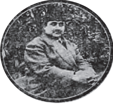
Azerbaycan Cumhuriyeti Millî Meclisi Reisi olup bu defa mezkûr cumhuriyet ahvaline dair muharririmize beyanat-ı mühimmede bulunan Resulzade Mehmet Emin Bey