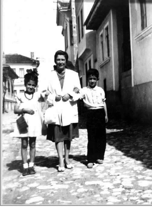
Annemle biz iki kardeş (Sokağımızda...)

bavullarla eve dönmüş. Bavullarda şeker, un, pirinç, yağ ve kaput bezi dolu; hem ev ahalisi, hem de komşular bayram etmiş. Asker, memur iyi ama ahali, çiftçi, köylü perişan... Stokçuluk ve suiistimal yaygın.