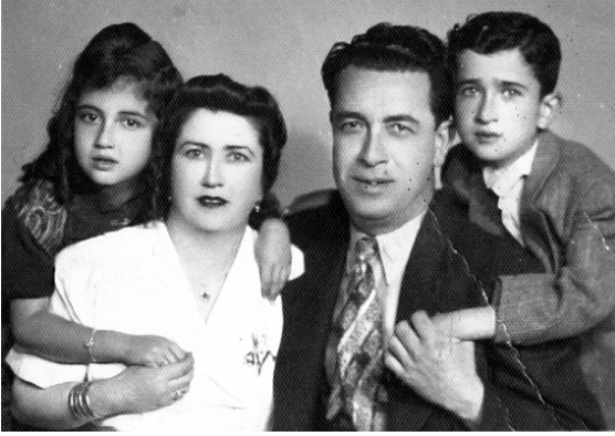
Babam, Annem ve biz iki kardeş...