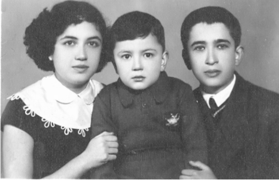
Üç kardeş beraber...