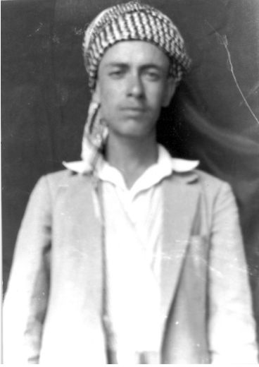
Babam Türkmen kıyafetinde...

ağabeyleri) nezdinde itibar sahibi... Hem Rıza Beğ ve ailesi ve hem de bizim aile Karacabeyi terk ederek dağa çıkıyorlar.