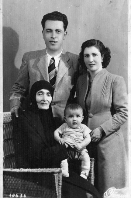
Anneannem, Babam, Annem, ablam..