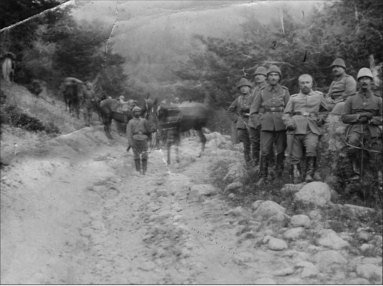
Vehip Paşa'nın 11. Tümen Cephesini teftişi 1916