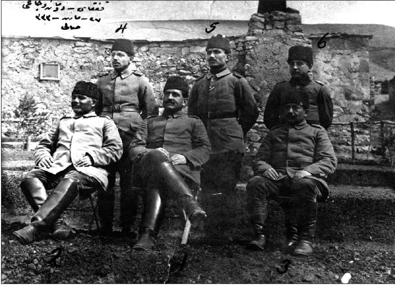
Kafkas Cephesinde Tümen karargâhının bulunduğu Duman Ocağı Köyünde 27 Mart [1]333'de [27 Mart 1917] alınan bir resim