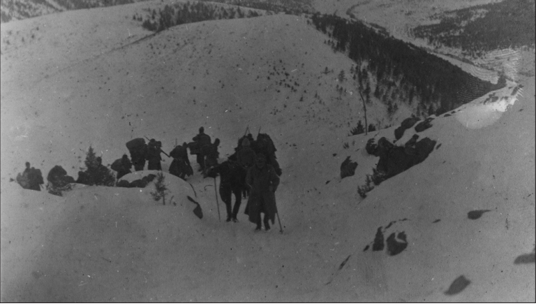
Kafkas Cephesinde: ileri mevzilere giderken