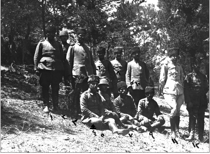
5. Kafkas Tümeni subayları - Seydi Baba Merası Hatıra- Çamlık 15 Temmuz 1333 [15 Temmuz 1917]