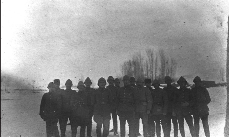
5. Kafkas Tümen Karargâhı, Duman Ocağı Köyü 1332