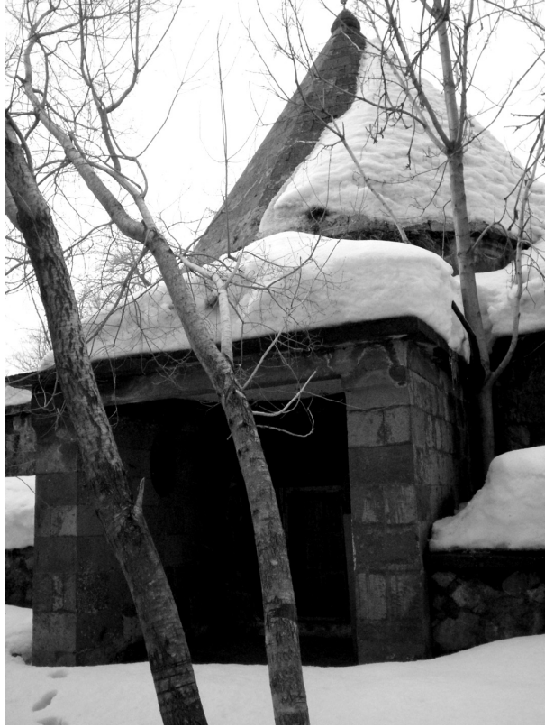
(Resim – 1) Şeyh Tahir-i Gürgî ve Mevlâna Hüsameddin Ali-ül Bitlisî'nin Türbesi