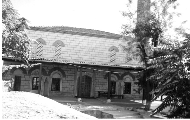
(Resim - IV)

Bir diğer görüş ise Ebu'l-Fazl Mehmed Efendi'nin hacca giderken Şam'da vefat ettiği'dir. Bu vefat olayı İslam Âlimleri Ansiklopedisi 'nde şöyle anlatılmaktadır: "Emekli olduktan sonra, İstanbul'da Tophane'de, denize nazır bir tepe üzerinde güzel bir ev yaptırdı. Orada talip-lilere, ilim âşıklarına günümüzün yüksek bilgilerini yaymağa, anlatmaya devam etti. Daha sonra bahçesine güzel bir cami ve bir mektep yaptırdı. Bu cami, "Defterdar Camii" diye meşhurdur. Caminin batısında, kendisinin defni için bir de türbe yaptırmıştı (Resim - IV).