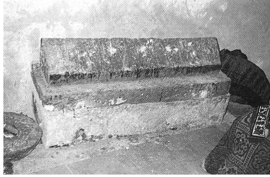
(Resim – II) Şeyh Tahir-i Gürgî'nin mezarı