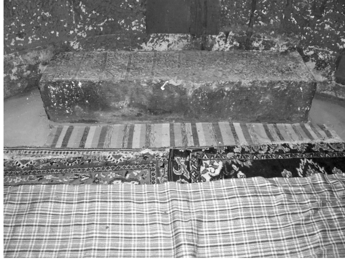
(Resim – III) Mevlâna Hüsameddin Ali-ul Bitlisi'nin Mezarı

Şeyh Hüsameddin, âlim ve faziletli bir kişidir. Kendisi, yazar ve mutasavvıftır. Bu değerli niteliklere sahip olması nedeniyle, ona aynı zamanda “Mevlâna” lakabı ile değer biçilmiş olduğu için, bütün yazarlarca “Mevlâna” unvanıyla anılmaktadır.