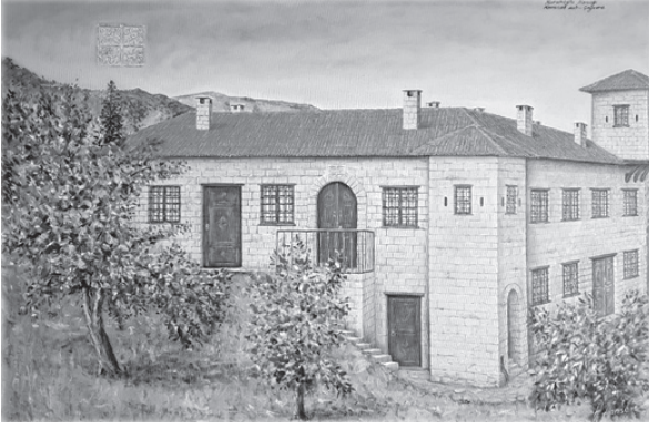
(Korunoğlu Konağı)