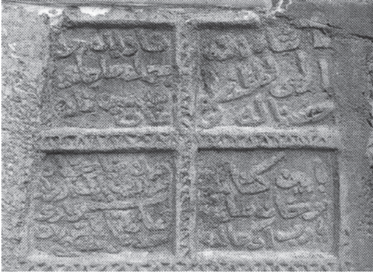
(Korunoğlu Konağının kitabesi,)