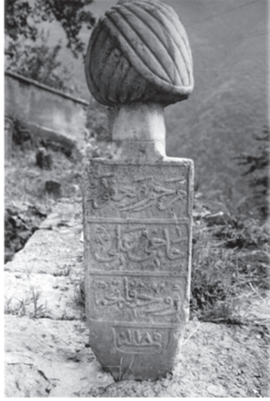
(Hacı Ali Efendinin mezar taşı)

Merhum ve mağfur Hacı Ali ruhuna fatiha Sene 1185 (1771-1772)