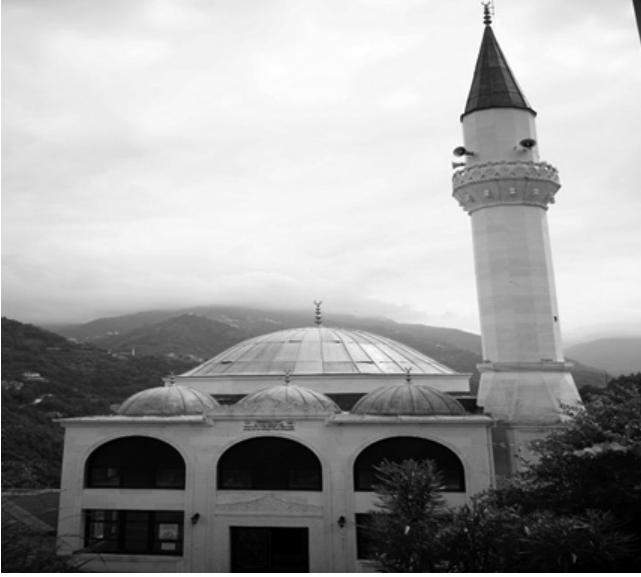
(Korunoğlu Camii,)