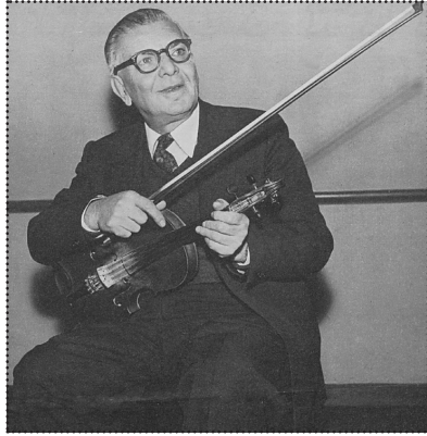
Sadi Işlay meşhur kemaniyla.

Deniz Kızı Eftalya'nın hatıralarında “aradığım erkeği buldum” sözleriyle taltif ettiği meşhur bestekâr ve kemani Sadi Işlay 5 Kasım 1899 tarihinde İstanbul Laleli’de doğdu. Babası Perukâr İsmail Efendi Rumeli muhaciriydi ve Laleli Türbesi’nin karşısındaki kiraathaneyi kiralararak bir tarafını ber-