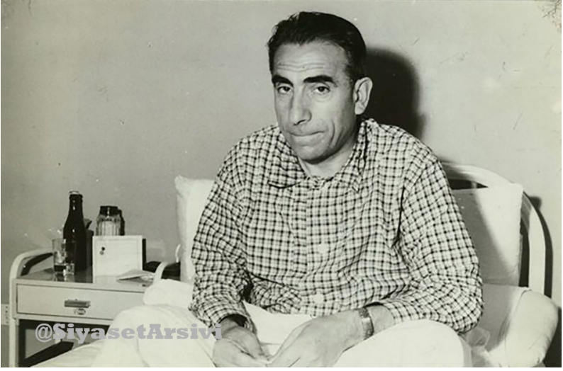
Alparslan TőrkeŐ Mevki Hastanesinde