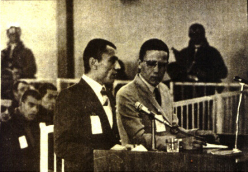
DuruŐma salonunda Muhsin Yazıcıođlu