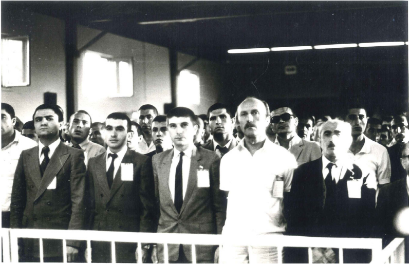
DuruŐma salonunda Ülkücü sanıklar