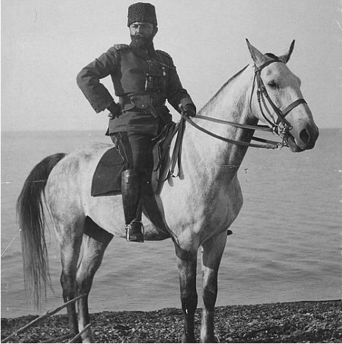
4. Ordu Kumandanı Cemal Paşa

Bundan sonra bütün karargah da Kudüs'e gelecekti. Cemal Paşa'nın Ordular Grubu Karargahını ziyaretinde seyahatinin hedefi hakkında kendisiyle görüşerek o zaman için Suriye'de şüphesiz en nüfuzlu olan bu zatın yardımını temine fırsat ve imkan bulmuştum.