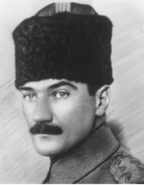
7. Ordu Kumandanı Mustafa Kemal Paşa