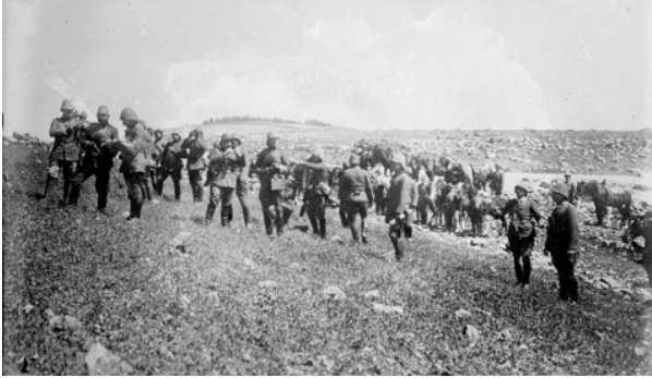
4. Ordu Kumandanı Cemal Paşa ve Miralay Trommer ve maiyetleri (önde solda)

Miralay Von Kress, elde bulunan kısa müddet zarfında mümkün olan şeyleri yaptı. Diğer işler arasında mesela çölde suyun temini için 5.000 devenin tedarik edilmiş olması zikredilebilir. 20.000 mevcudunda olarak 1915 Şubat'ında Birüssebi'den beş yürüyüşte ve pek fazla zayıf vermeksizin çölü geçmiş olan kıtaatın yürüyüş kabiliyeti takdire şayandır. 2