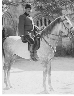
4. Ordu Kumandanı Mersinli Cemal Paşa