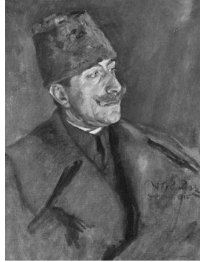
8. Ordu Kumandanı Cevat Paşa

26 Mart'ta İngilizler, kuvvetli kıtaat ve bilhassa süvari ile aşağı Şeria Vadisi'nde baskın tarzında şimalişarki istikametinde taarruza geçti. Bu suretle meydana gelen I. Şe-