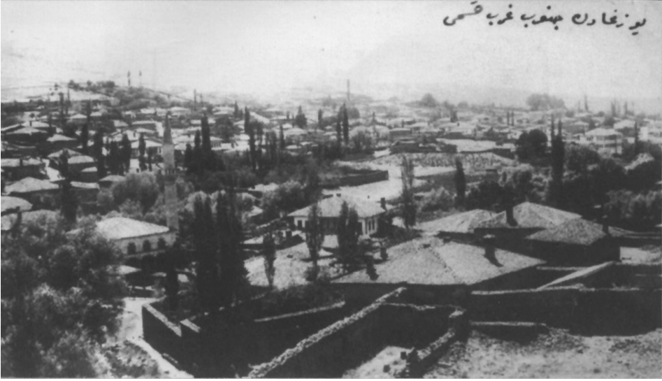
Seferberlik günleri. Yozgat'ın cenûb-i garbî kısmı.

dım. Hoş geldin, hoşnutluk getirdin. Hamdolsun artık gâzî oldun. Senin manevî merteben o kadar ulvî ki sadece bir saatlik nöbetin bile bin senelik nafilâ ibadetten daha üstün. Neyse! Hele biraz dinlen. Gez dolaş, hasret gider. Seni gördük şâd olduk.” diye delikanlıya iltifatlarla kuvve-i maneviyyesini tahkim eder. Hiç yüzüne gelip de perişan etmez misafiri. Biraz sohbetten ve cepheden haber aldıktan sonra evden ayrılır.