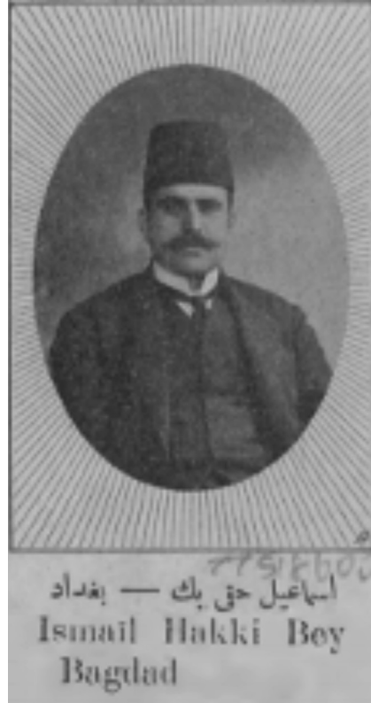
EK-1 İsmail Hakki Bey'e Ait Fotoğraflar (Taha Toros Arşivi)