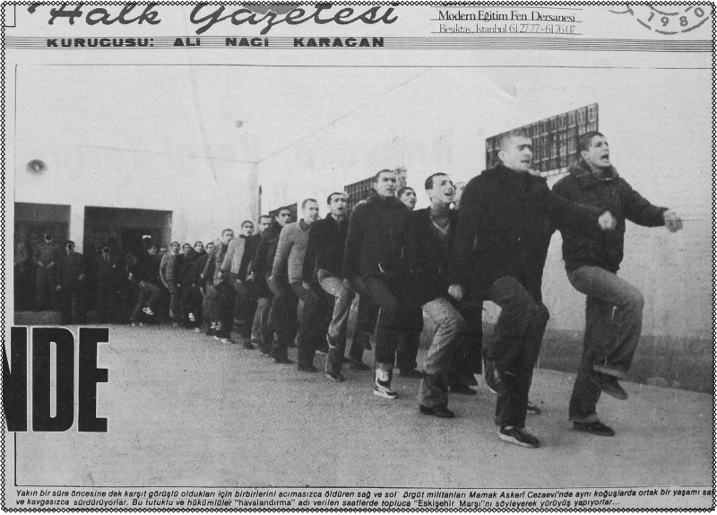
Milliyet, 06.12.1980, s. 1.